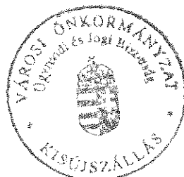
Molnár Imre bizottsági elnök