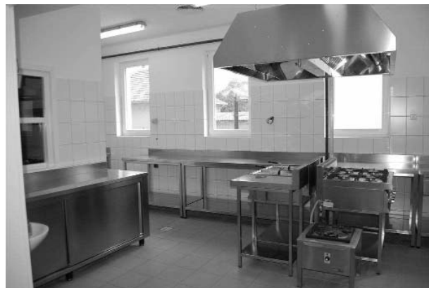
(A kép illusztráció)

Új konyha építésére azért volt szükség, mert a jelenlegi már nagyon leromlott. A 285 m 2 -es új épület 350 adag étel kiszolgálására lesz alkalmas. A kivitelezési munkákat a Szilasi és Társa Kft. végzi, a konyhai eszközöket az MLM 2001 Bt. szállítja.