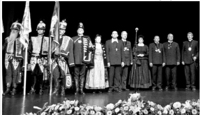
Május 6-án a Vigadóban került sor a III. Megyei Jászkun Emléknapra