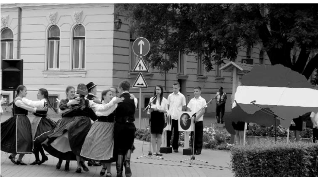
Az ünnepi műsort a Kossuth Lajos Baptista Általános Iskola és Kollégium tanulói, valamint a Baptista Alapfokú Művészeti Iskola néptánc tanzakos növendékeinek köszönhetjük