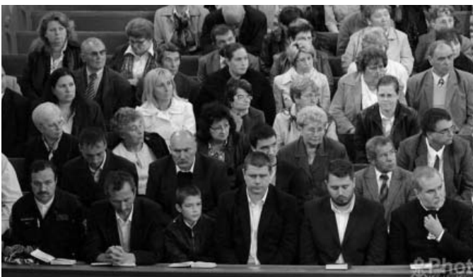
Május 15-én Pacséron istentiszteleten emlékeztünk meg a kitelepülésről