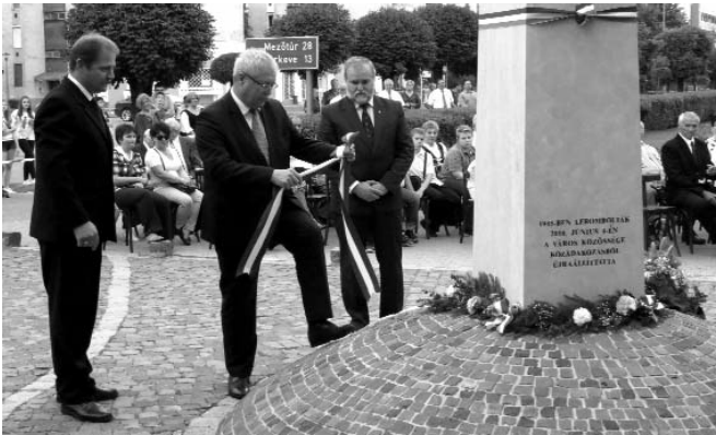
Az emlékműnél emlékszalagot helyeztek el dr. Fazekas Sándor földművelésügyi miniszter; városunk országgyűlési képviselője, Kecze István polgármester, valamint Tatár Zoltán alpolgármester