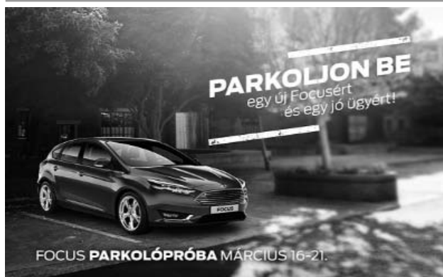
FOCUS PARKOLÓPRÓBA MÁRCIUS 16-21.

www.facebook.com/szalaykonyvek www.szalaykonyvek.hu