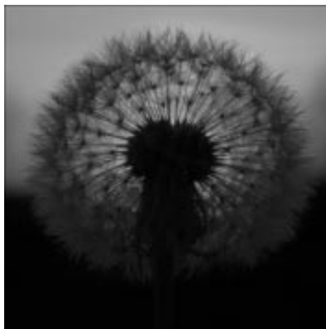
Losonczy József: Tűzgömb