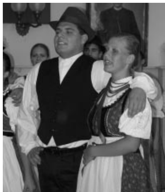
Ketten a Nagykun Táncegyüttesből