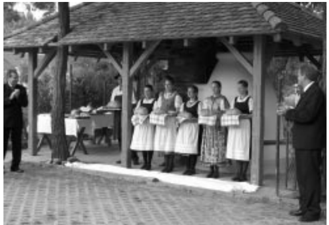
A Nagykun Táncegyüttes tagjai a kemence avatásán az új, frissen sült kenyérral kínálták határon túli vendégeinket is

Ez a kemence bizonyíték is. Bizonyíték arra, hogy összefogással a cél érdekében milliós nagyságrendű értékeket tudunk teremteni! Ez a kemence hagyományápolás, ahol az idősebb városlakók meg tudnak