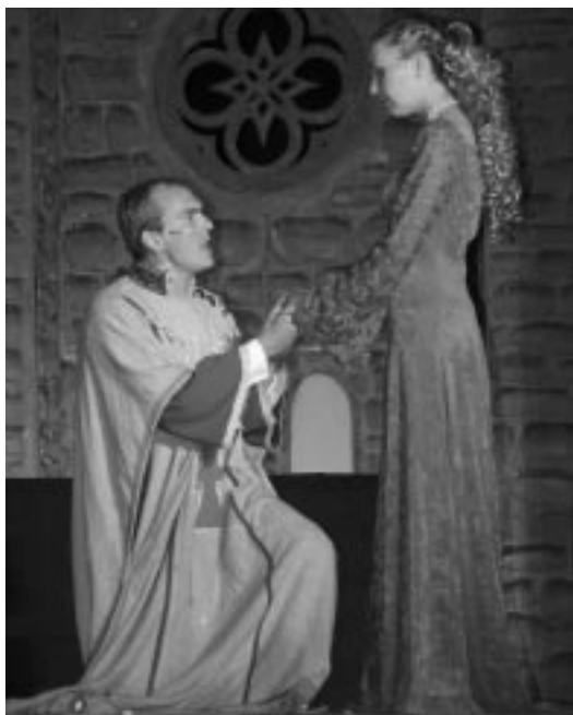
Az István, a király című rockopera egyik emlékezetes jelenete