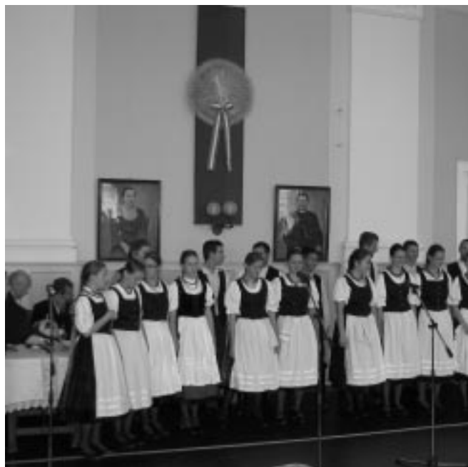
A Nagykun Táncegyüttes