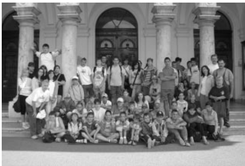
A XXI. városszépítő hét résztvevői a Városháza előtt