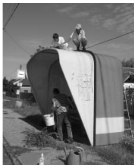
Tiszta lesz a Bittner falusi buszmegálló