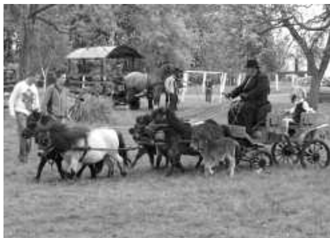
... és kicsiknek