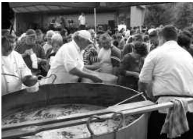
A hatalmas bográcsban főtt gulyáslevesnek nagy sikere volt