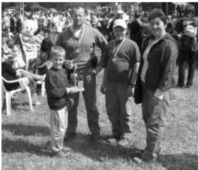
A lövészverseny győztese: a kenderesi Krokavec család