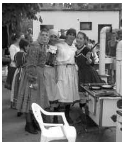
...ahol fiúk is csak lányruhában lehettek