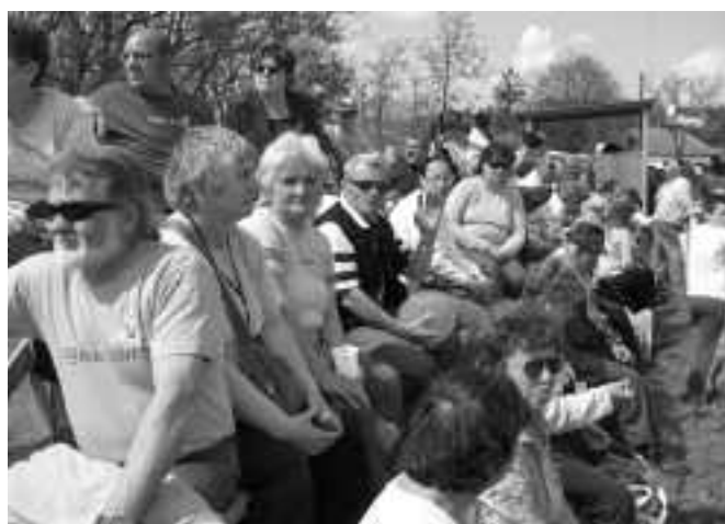
A közönségnek mindenfelé akadt néznivalója