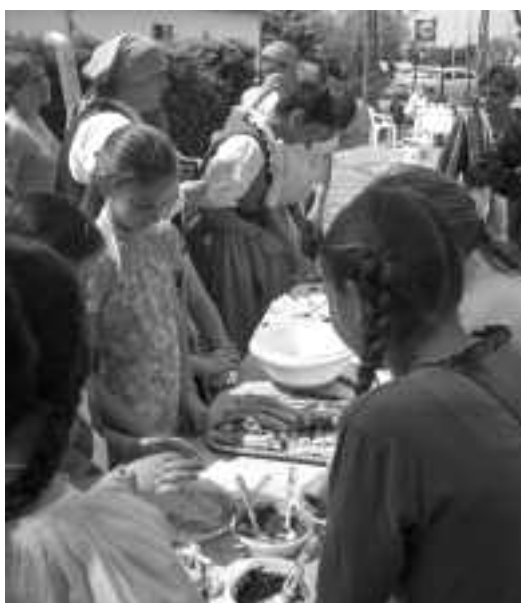
Palacsintasütés a lánytáncfesztiválon...